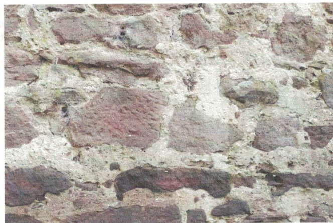
Appareil de moellons de grès, avec nombreuses calles de grès noyées dans les reliquats d'enduit (Château du Wineck)