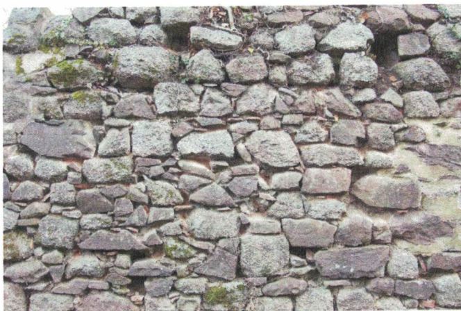
Appareil mixte avec joints de natures diverses ; tuile, schiste, granite (Château d'Andlau)