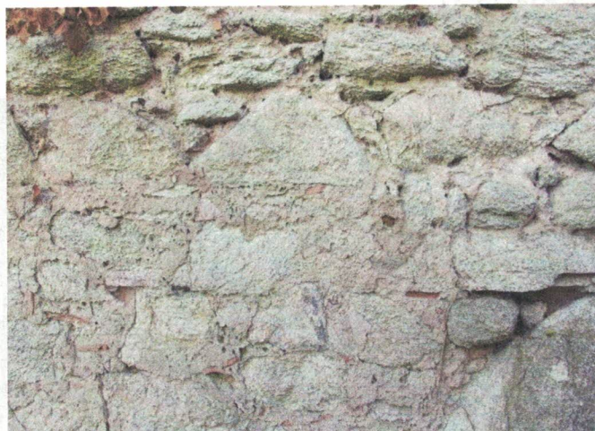
Ortenbourg, autre partie du même mur, non dégradée